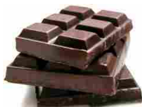
Pianta di cacao 'in via d'estinzione': ecco cosa mangeremo...