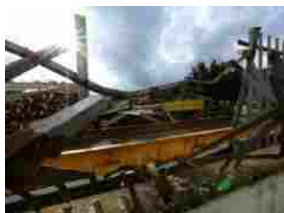
Terremoto, Ue: prima dell'estate nuovi soldi per la ricostruzione