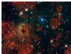
Astronomia: nuova mappa tridimensionale delle polveri che avvolgono la...