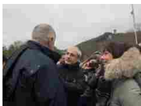
Protezione Civile: il Capo Dipartimento Curcio riceve un'onorificenza da...