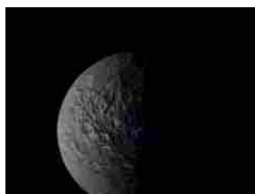
Astronomia: il mistero delle trappole fredde e dell'origine del...