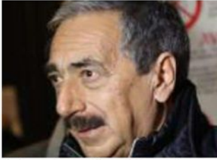
Il giornalista Marino Bartoletti