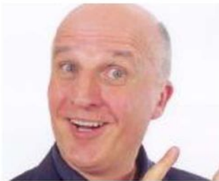
Il comico Paolo Hendel