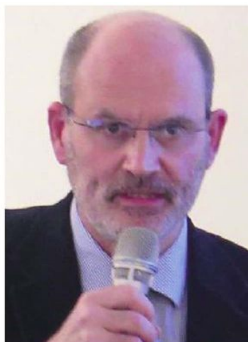
UNIVERSITA' Marco Pilotti