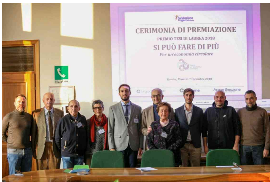
La premiazione delle migliori tesi di laurea a Cogeme, Rovato

Il concorso per tesi di laurea "Si può fare di più" da diversi anni offre la possibilità a studenti, provenienti da tutte le Università italiane, di poter mettere a "valore" le proprie "fatiche" e al contempo incentivare possibili collaborazioni nei settori di competenza del premio. Una delle novità previste in queste ultime due edizioni è stata quella di tramutare il premio in denaro in tirocini lavorativi presso le aziende del gruppo consentendo da un lato una maggiore congruenza con lo spirito del premio stesso e dall'altro di arricchire l'esperienza aziendale nel comparto ricerca e innovazione. Un segnale molto positivo se correlato ai servizi erogati dal gruppo Cogeme (acqua, energia, ambiente) e confortato anche dai numeri importanti che dal