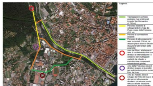
“Il corridoio ecologico per Verbania circolare”

Il progetto avrà una durata di circa tre anni e prevede la rigenerazione articolata e la valorizzazione di un’area baricentrica della città di Verbania, mediante il recupero e la riqualificazione dell’area urbana cosiddetta “della Francese” (in viale Azari) con la creazione di un Polo del Riuso, di un collegamento pedonale all’ambiente fluviale del Torrente San Bernardino e la valorizzazione di quest’ultimo come risorsa naturale