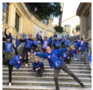
Retake Roma interviene su Piazza Iside: rimozione di tag e stickers e pulizia aiuole

ROMA ATTUALITÀ SALUTE SCIENZA&TECNOLOGIA ARTE&CULTURA FASHION&DESIGN ANIMALI GOOD NEWS TV CERCA DIRETTA LIVE