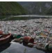
Bosnia, isole di rifiuti intasano il fiume Drina. Ecco cosa è successo

Tags: capannori ECONOMIA CIRCOLARE mozziconi sigarette progetto focus