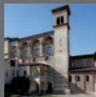
Centri di potere e di culto nell'Italia longobarda Bs-Va 2011