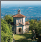
Sacri Monti del Piemonte e della Lombardia Va-Co 2003