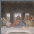
Santa Maria delle Grazie e Cenacolo Vinciano Mi 1980