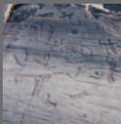
Arte rupestre della Valle Camonica Bs 1979