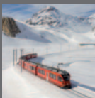
Ferrovia retica nel paesaggio dell'Albula e del Bernina So 2008