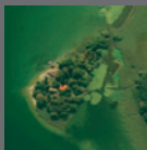
Palafitte dell'arco alpino Va-Bs-Mn-Cr 2011