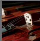
Il Saper fare del violino tradizionale di Cremona Cr 2012