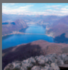
Monte San Giorgio Va 2010