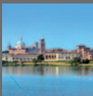
Mantova e Sabbioneta Mn 2008