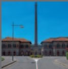
Villaggio operaio di Crespi d'Adda Bg 1995