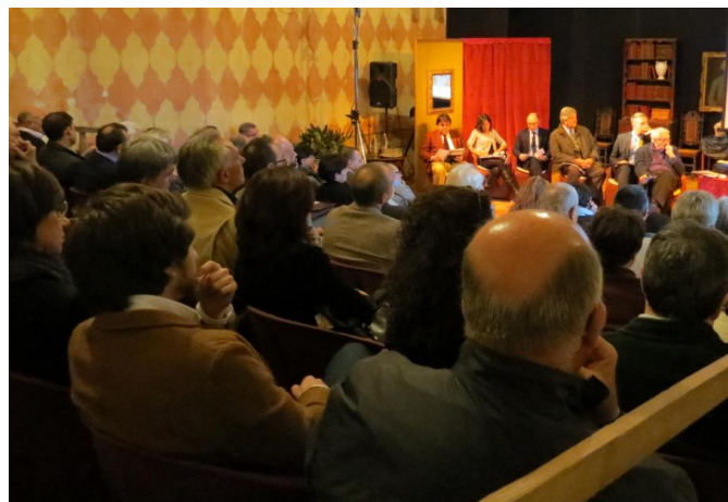
Rovato, 1 dicembre 2015