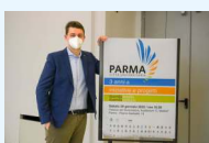
Parma Città Universitaria 2022