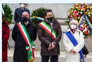
Commemorazione morte Giuseppe Verdi