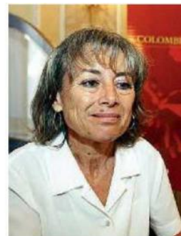
Giornalista/2. Giuliana Sgrena