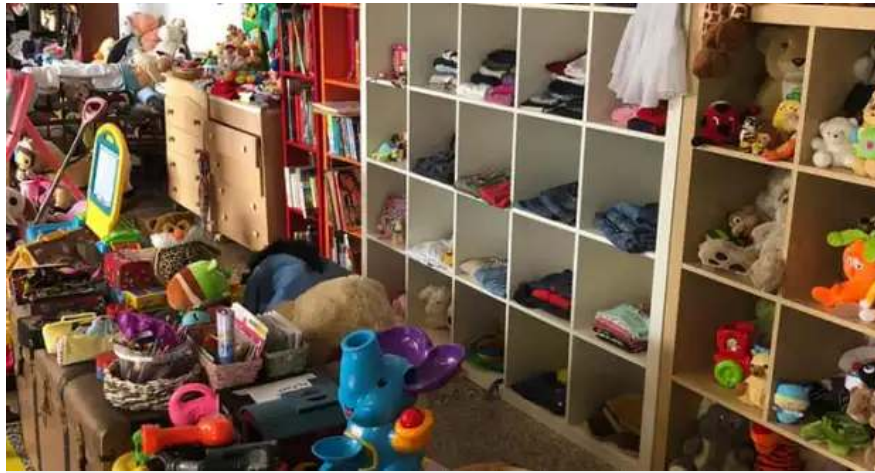
Banco del riuso, foto da pagina Facebook Comune Rovato