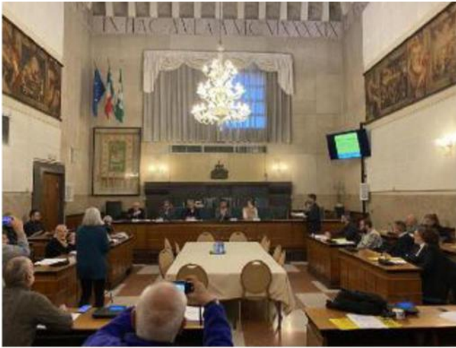
A Palazzo Broletto la presentazione dell'iniziativa del 18 marzo

spettivamente il 5 maggio all'auditorium San Barnaba, in città, e il 15 settembre a Bergamo. «Terre di mezzo» diventerà anche un documentario audiovisivo, realizzato dagli studenti e dalle studentesse dell'Accademia di Belle Arti Laba. ●