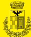
Comune di Torre Pallavicina