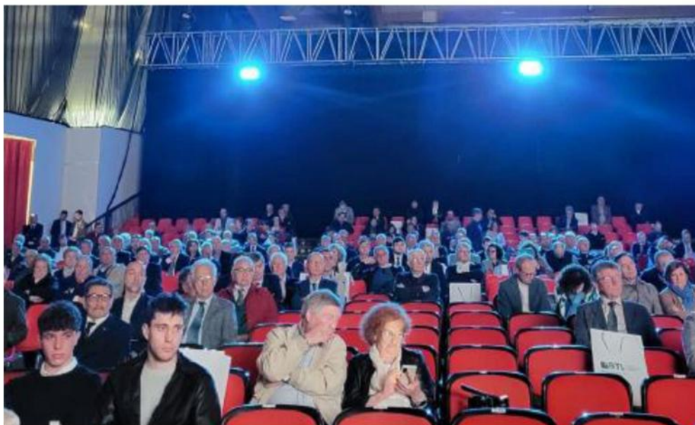
Anche per i soci della BTL - Banca del Territorio Lombardo l'assemblea di quest'anno è tornata in presenza

Ritaglio Stampa ad uso esclusivo del destinatario. Non riproducibile