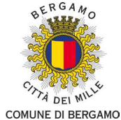
COMUNE DI BERGAMO