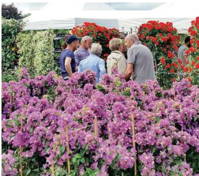
Fiori ed essenze. Grandi protagonisti a Bornato