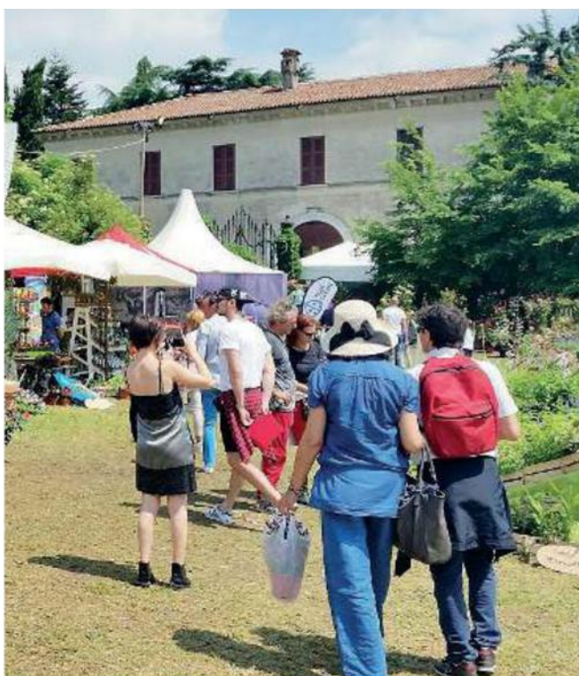
Bagno di folla. Atteso un folto pubblico per Franciacorta in fiore

Ritaglio Stampa ad uso esclusivo del destinatario. Non riproducibile