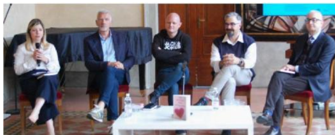
La presentazione nella sala del Pianoforte

Nel libro emerge in modo forte la passione di Trapassi per la musica, ma se i temi sono profondi, lo stile di scrittura, come rimarcato da Archetti, è incalzante, semplice: da leggere tutto d'un fiato.