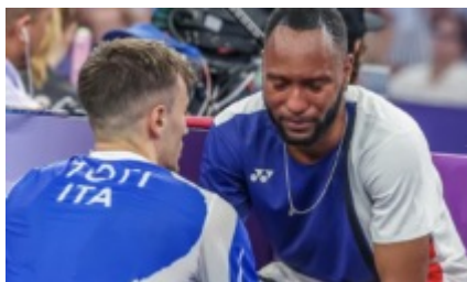
Lo sport che piace