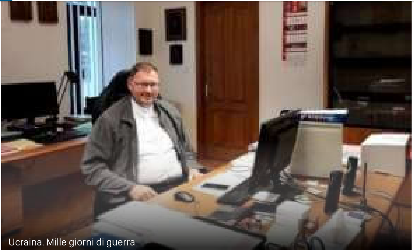
Ucraina. Mille giorni di guerra