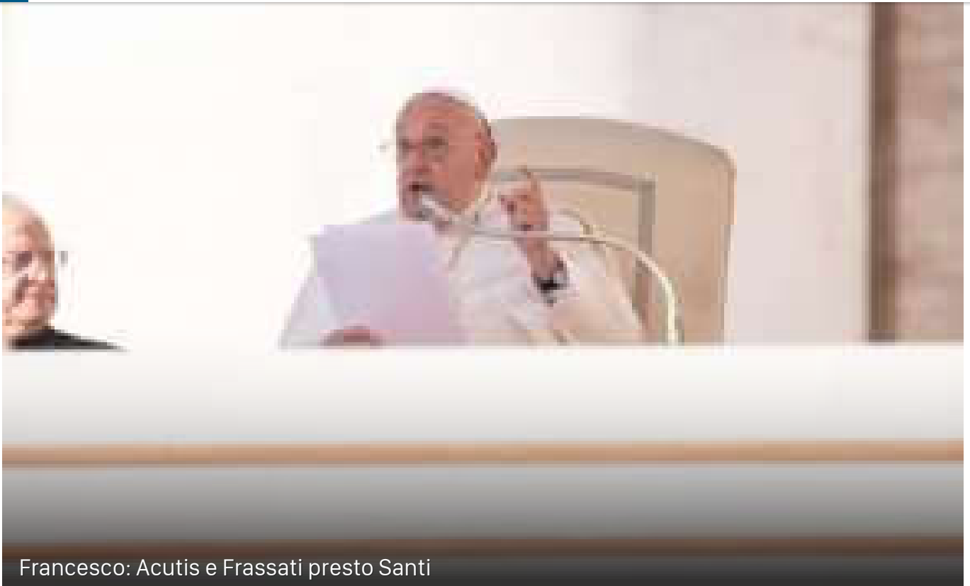
Francesco: Acutis e Frassati presto Santi